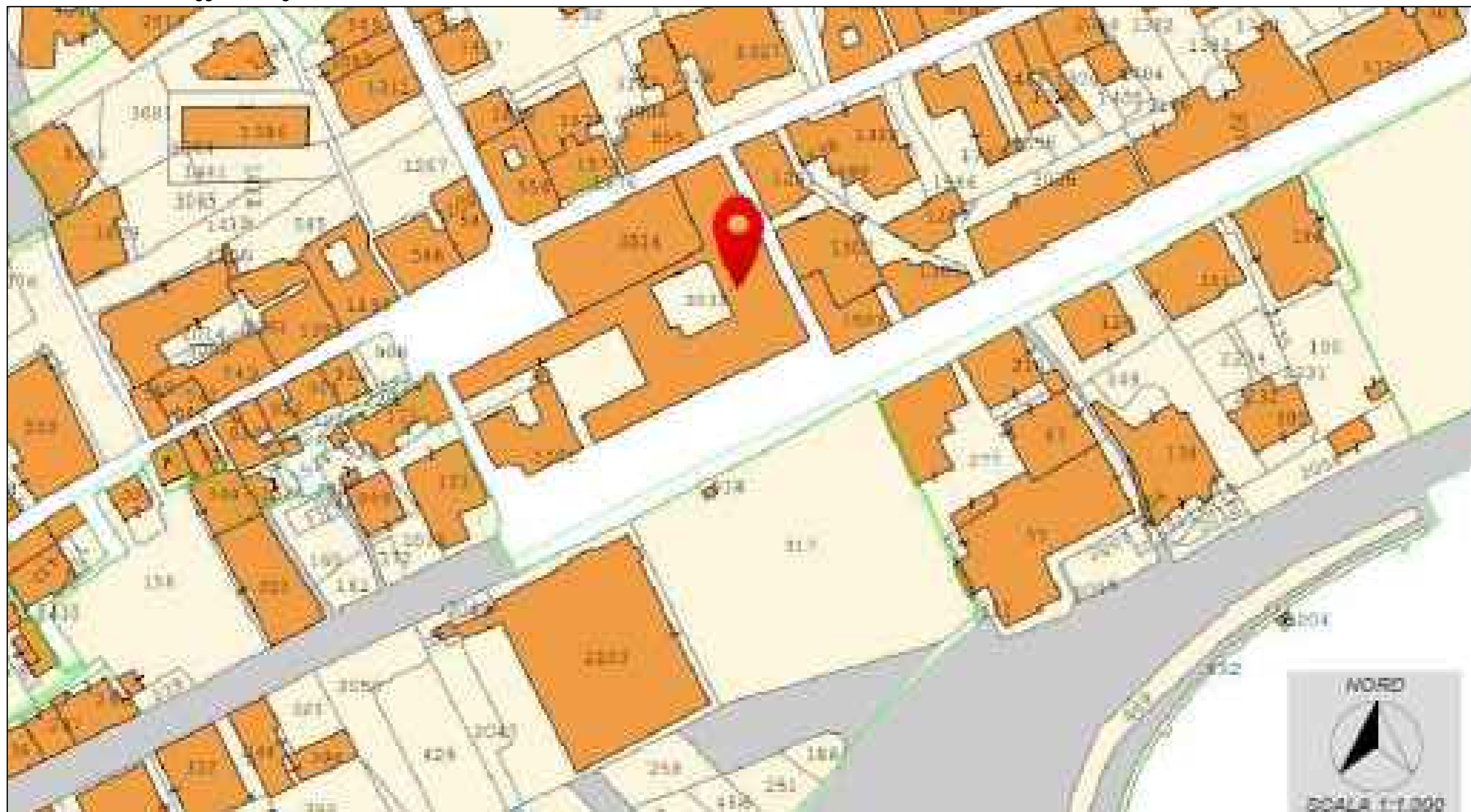
Stralcio Planimetria Catastale - Comune di Formia - Sezione A - Foglio 21 - Allegato B - Particella 3033