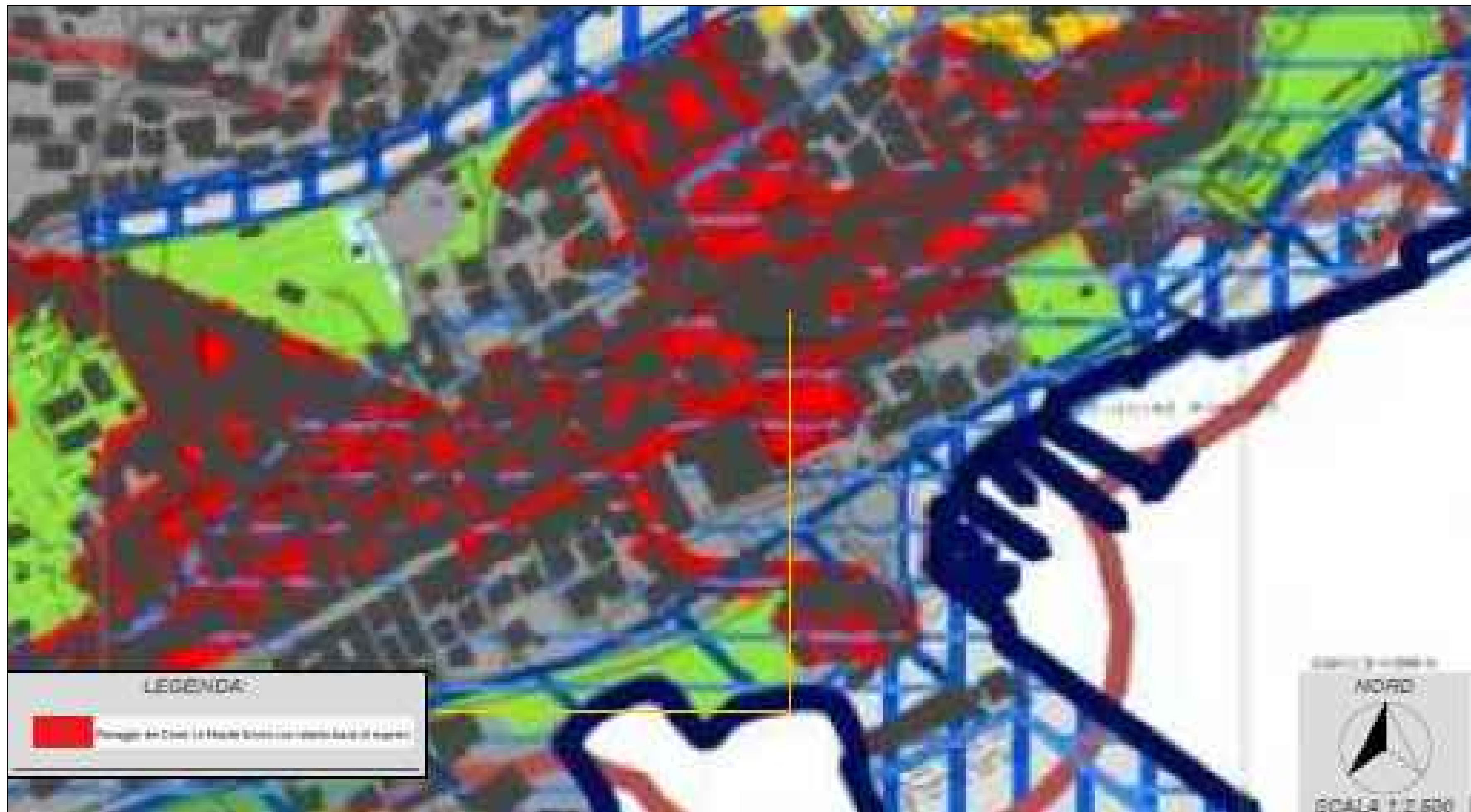
Piano Territoriale Paesaggistico Regione Lazio - Tavola A 41- 415