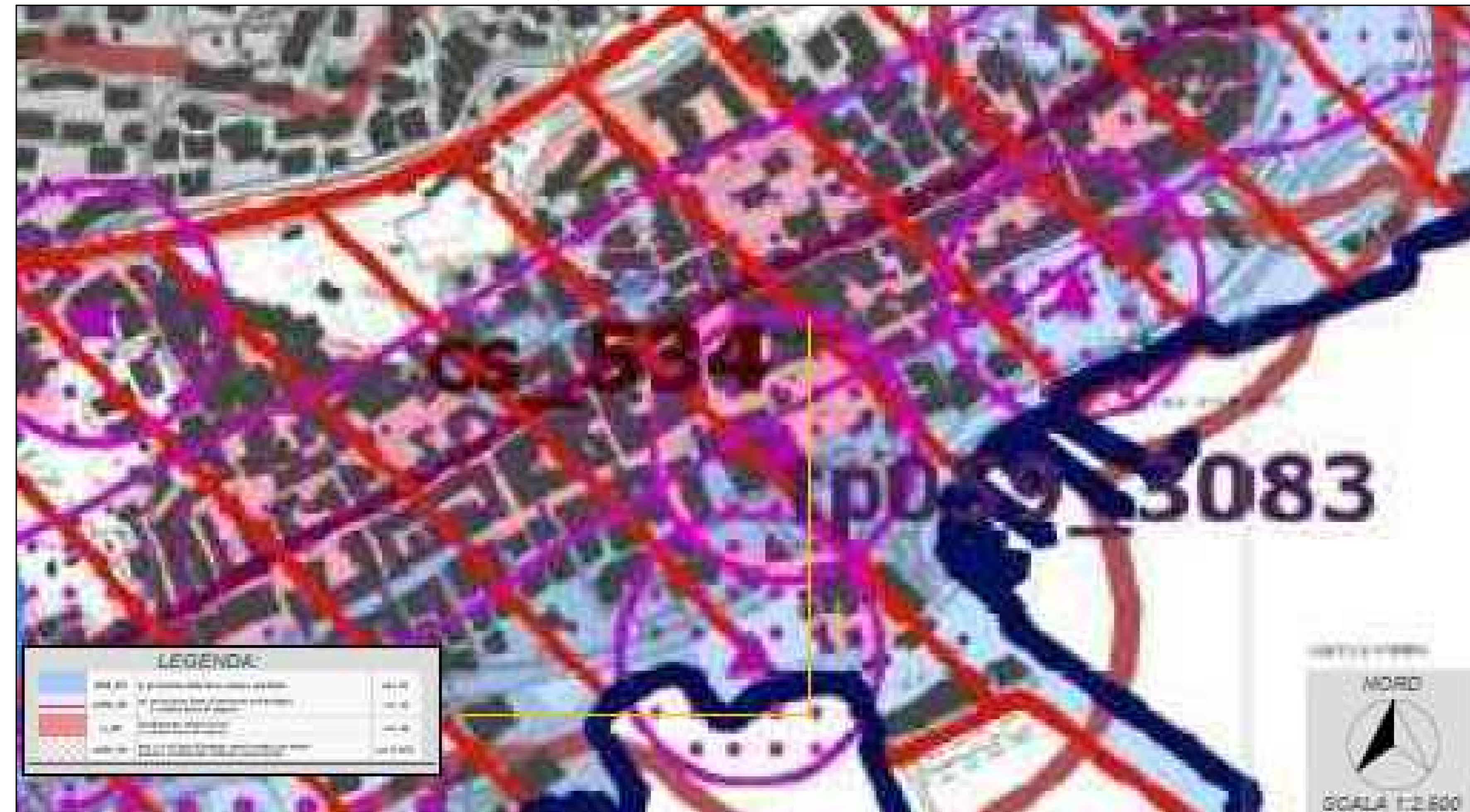
Piano Territoriale Paesaggistico Regione Lazio - Tavola B 41- 415