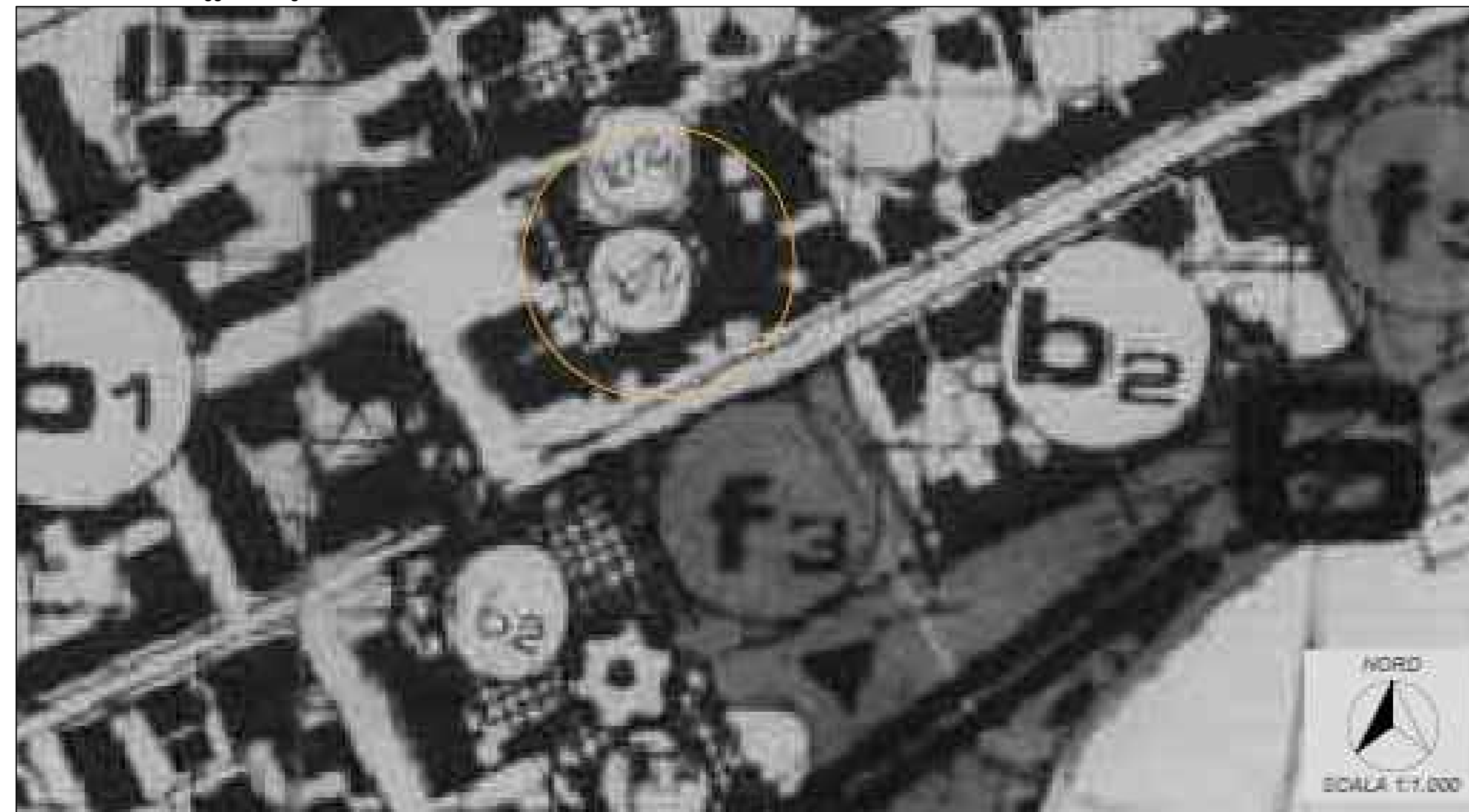
Stralcio Piano Regolatore Generale Comune di Formia