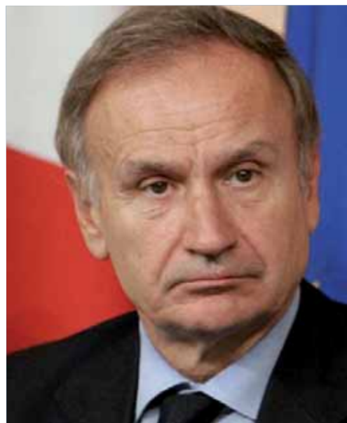
Il presidente del C.O.N.I. Gianni Petrucci