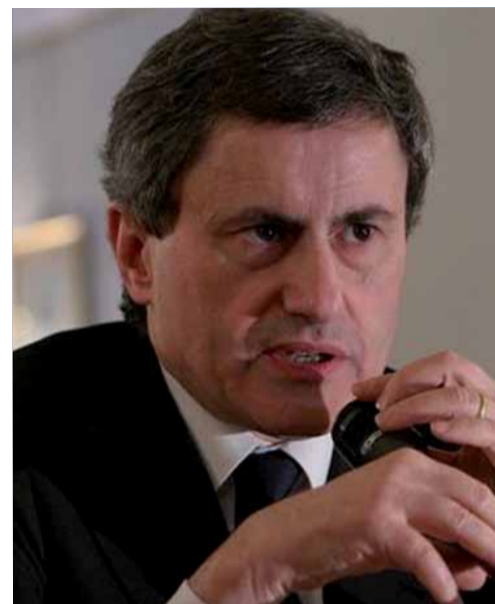
Il sindaco di Roma On. Gianni Alemanno