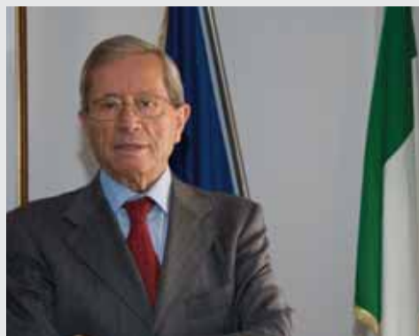
Sen. Michele Forte Sindaco di Formia

DIFENDIAMO GLI INTERESSI DELLA NOSTRA CITTÀ